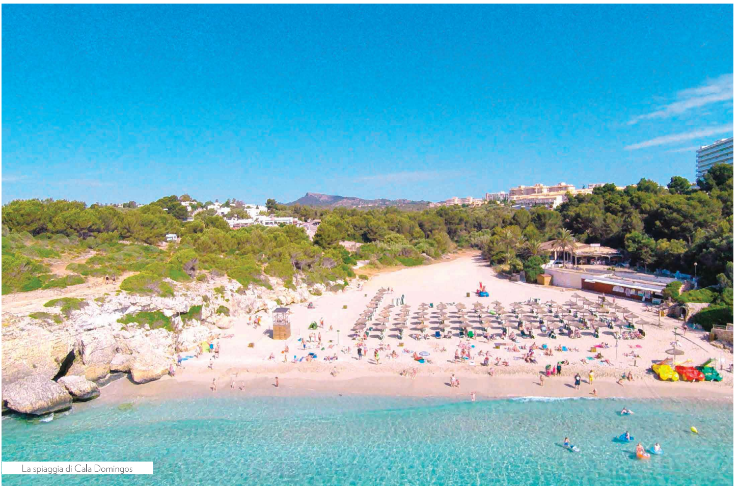
La spiaggia di Cala Domingos

La spiaggia di sabbia dista circa 100 m. L'hotel dispone di 2 piscine di cui 1 per bambini. Lettini e ombrelloni disponibili fino ad esaurimento presso le piscine (teli mare non disponibili).