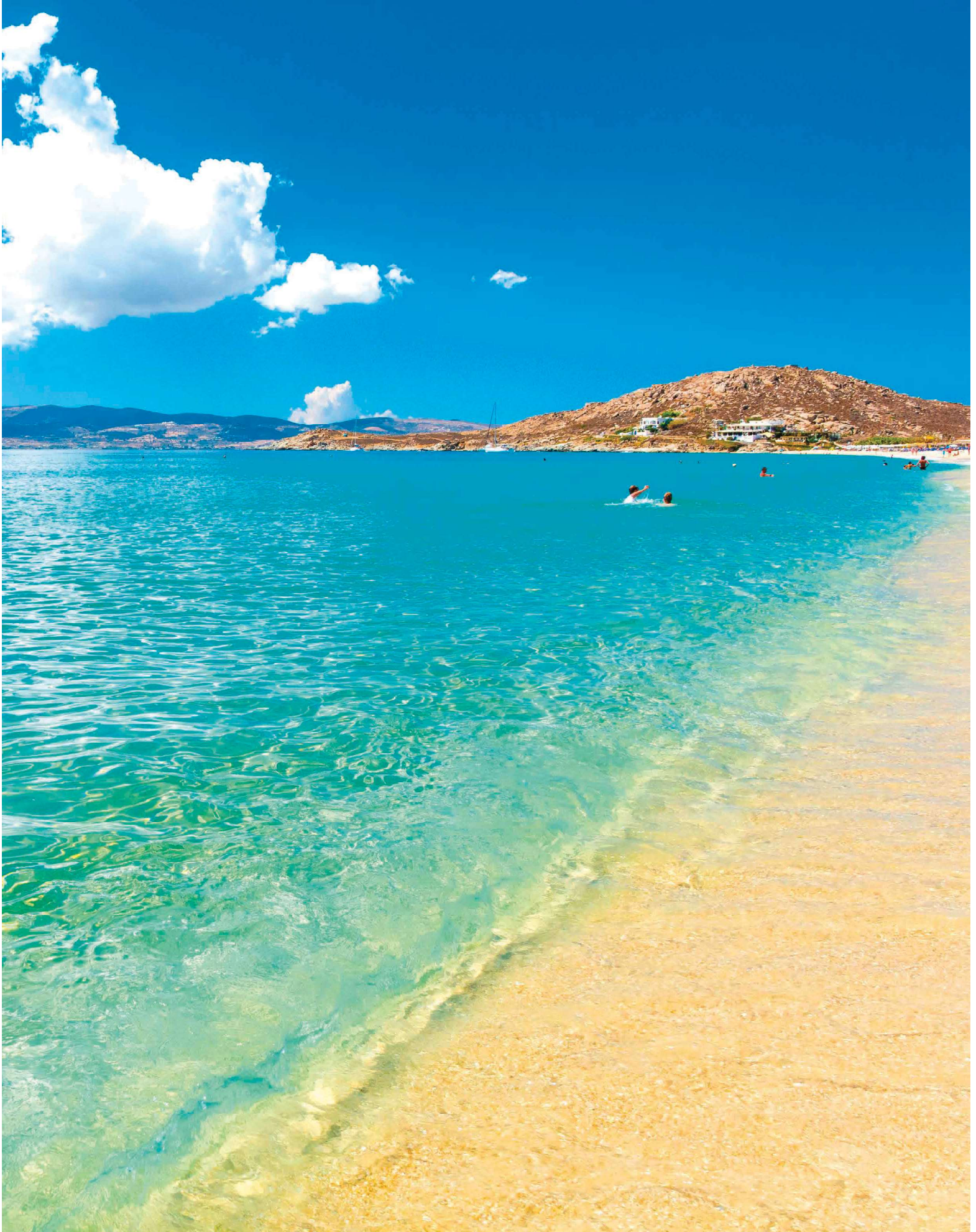
Spiaggia di Agios Prokopios